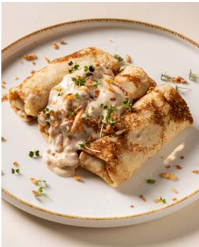
БЛИНЧИКИ С КУРИНЫМ ФИЛЕ 280 г | 399.- в соусе Карбонара