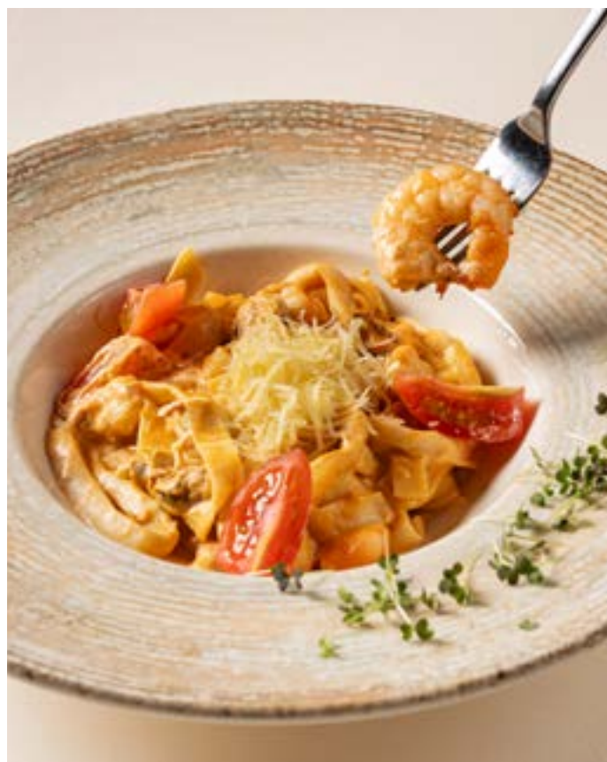
ТАЛЬЯТЕЛЛЕ С МОРЕПРОДУКТАМИ