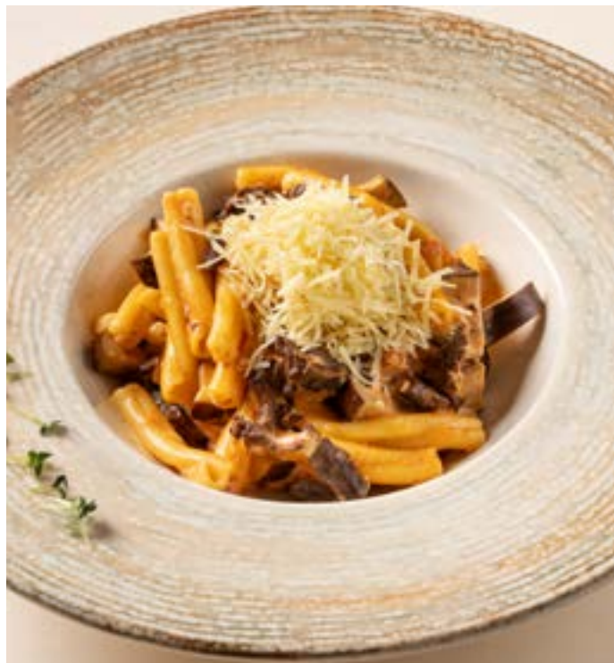
КАЗЕРЕЧЧЕ С ГОВЯДИНОЙ И БАКЛАЖАНАМИ