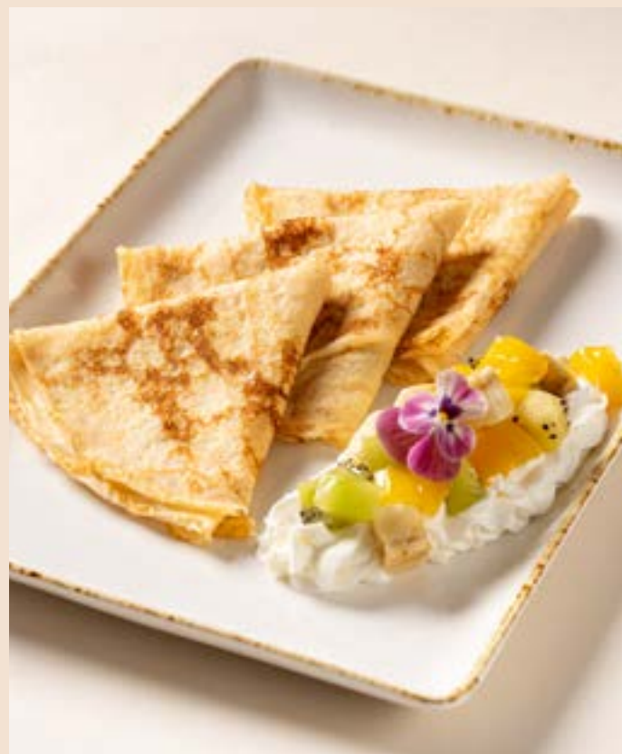
БЛИНЧИКИ С ФРУКТОВЫМ ТАРТАРОМ 260 г | 349.- и сыром маскарпоне