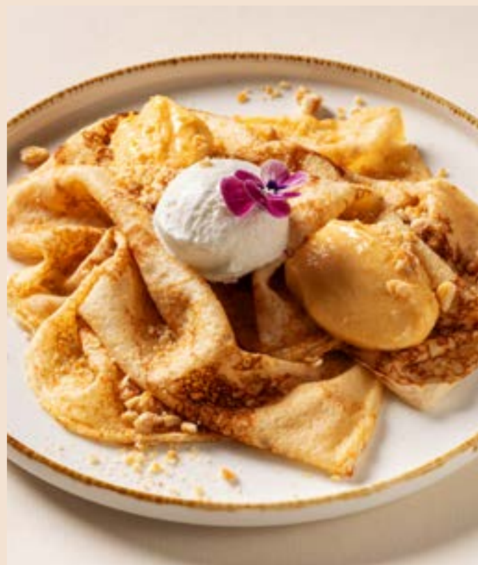
БЛИНЧИКИ С АПЕЛЬСИНОВЫМ КУРДОМ 265 г | 399.-