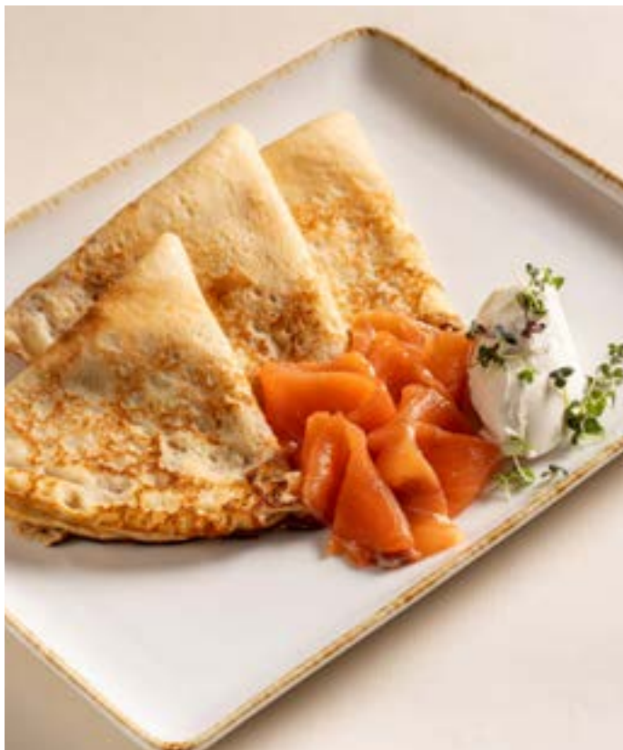
БЛИНЧИКИ С СЕМГОЙ 245 г | 499.- и сливочным сыром