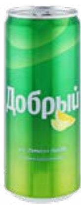
Добрый Лимон-Лайм 0,33 119.-