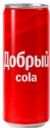
Добрый Кола 0,33 119.-