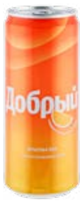
Добрый Апельсин 0,33 119.-