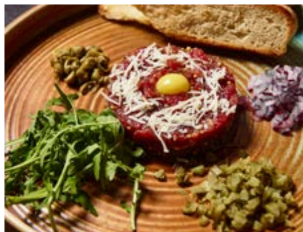
ТАРТАР ИЗ ГОВЯЖЬЕЙ ВЫРЕЗКИ 175 г 368₽ 590₽*