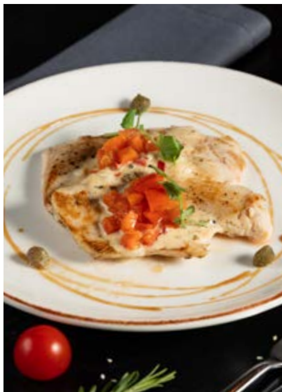
су-вид КУРИНАЯ ГРУДКА С ОВОЩАМИ КОНФИ 190 г