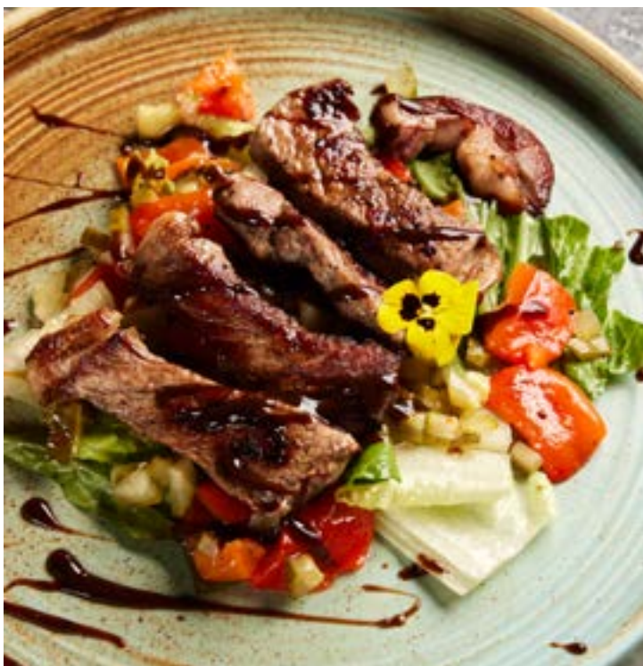
NEW 🍷 СТЕЙК-САЛАТ ИЗ СТРИПЛОЙНА 396₽ 185 г 595₽* с печеным перцем, ферментированными огурцами в соусе Черный перец