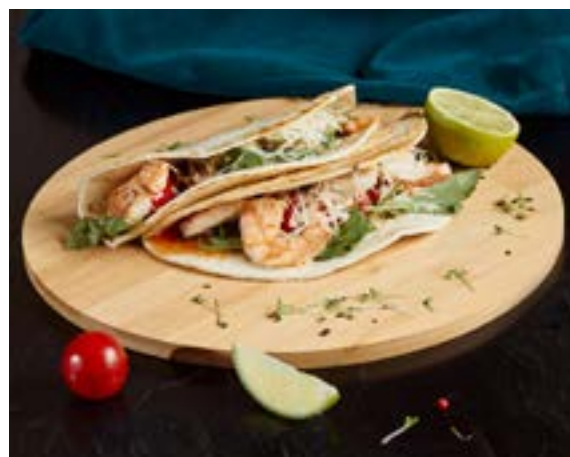
ТАКО С КРЕВЕТКАМИ 230/50 г 313₽ 525₽* помидорами черри и рукколой в соусе Сладкий чили