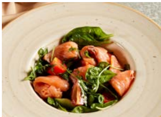
NEW САЛАТ ИЗ КОПЧЕНОГО 454₽ ЛОСОСЯ 240 г 785₽* с авокадо и рукколой под соусом Цитронет