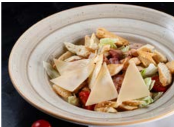
ФИРМЕННЫЙ ЦЕЗАРЬ 257₽ С КУРИЦЕЙ 230 г 425₽* и хрустящим беконом с соусом из анчоусов