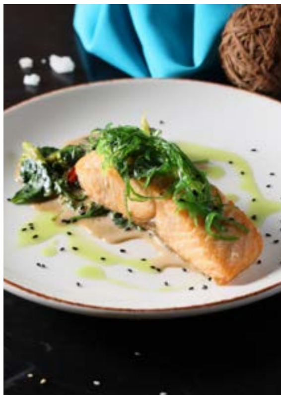
СТЕЙК ИЗ СЕМГИ 120/50 г с брокколи и бланшированным шпинатом