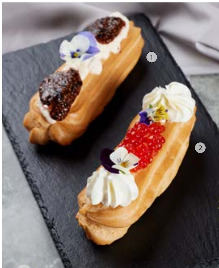
① ЭКЛЕР С ИКРОЙ ЧИА И МУССОМ ИЗ КРЕВЕТОК 70 г 88₽ 160₽*

сливочным сыром, авокадо и кедровыми орехами