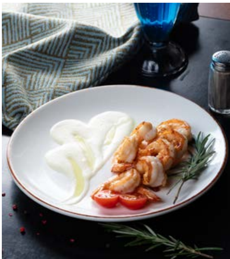
ТИГРОВЫЕ КРЕВЕТКИ НА ГРИЛЕ 7 шт/40 г с соусом Фуметто