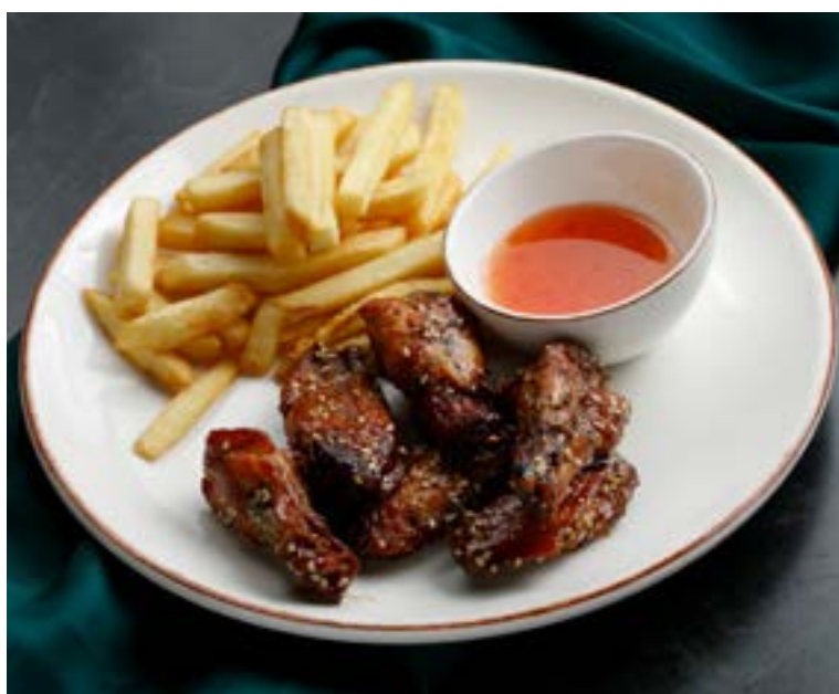
КУРИНЫЕ КРЫЛЬЯ В СОУСЕ «ТЕРИЯКИ» 170/100/30 г с хрустящим картофелем фри и соусом Сладкий чили