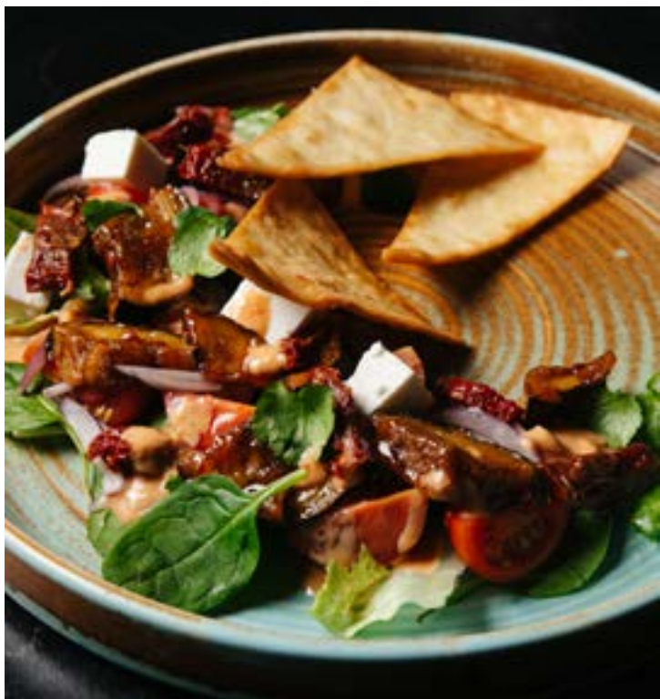
САЛАТ ИЗ БАКЛАЖАНОВ 276₽ С ТОМАТАМИ 235 г 430₽* на листьях Римского салата с брынзой, заправлен нежно-острым соусом