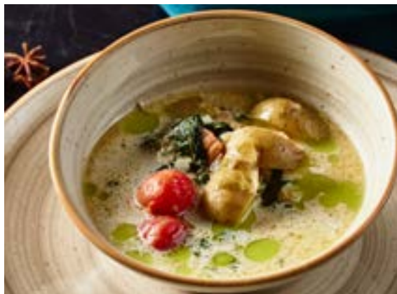
ЛОХИКЕЙТО 250 г сливочно-рыбный суп с картофелем по-деревенски и шпинатом