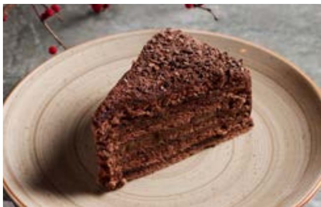
ТРЮФЕЛЬ С БАНАНОМ 135 г

бисквит с какао со сливочно-шоколадным кремом и бананами