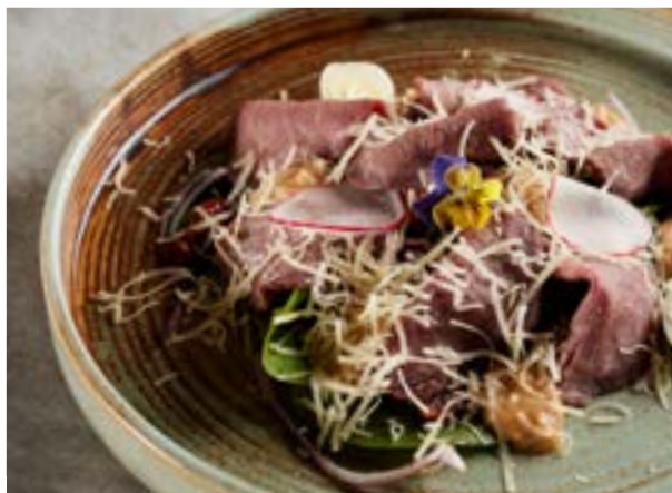
САЛАТ С РОСТБИФОМ 200 г 251₽ и жареным цукини под арахисовым 425₽* соусом