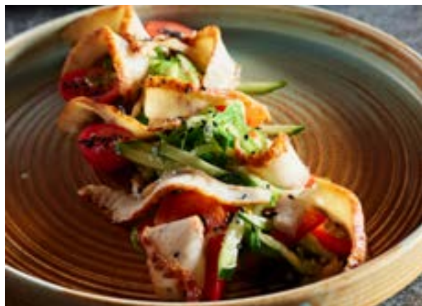
САЛАТ С УГРЕМ 315₽ 180 г 490₽* салатом Чука и хрустящими овощами