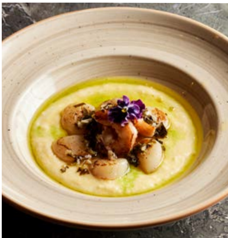
NEW ПОЛЕНТА С ГРЕБЕШКАМИ 220 г и креветками под лимонно-чесночным соусом