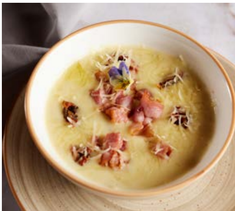
СУП-ПЮРЕ ИЗ КАРТОФЕЛЯ 350 г с хрустящим беконом, вялеными томатами и сыром Пармезан