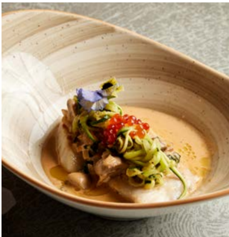
NEW 🐟 СУДАК В СОУСЕ ТОМ ЯМ 220 г с грибами, цукини и красной икрой