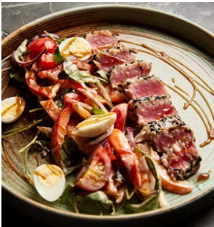
NEW ТАТАКИ ИЗ ТУНЦА 210 г 297₽ с овощами в кунжутном соусе 470₽*