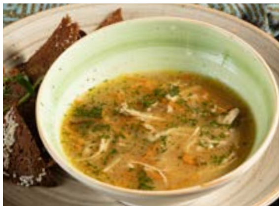
СУП-ЛАПША КУРИНАЯ 250 г с чесночными гренками