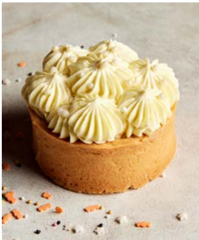
NEW ТАРТ С МАРАКУЙЕЙ