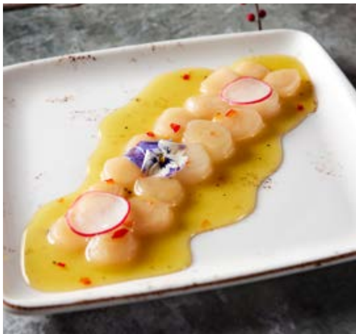
СЕВИЧЕ ИЗ ГРЕБЕШКА 105 г в горчишно-медовой заправке