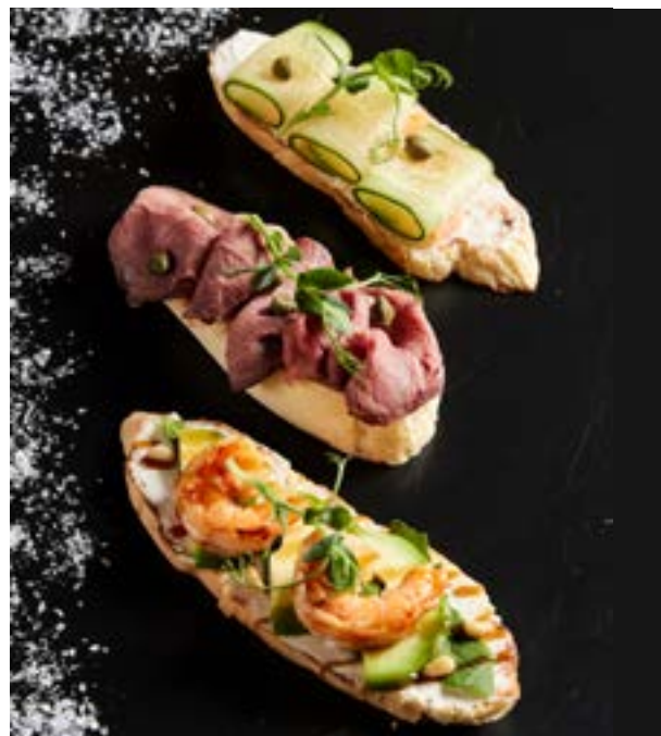
NEW АССОРТИ ИЗ БРУСКЕТТ 295₽ 3 шт/200 г 490₽*