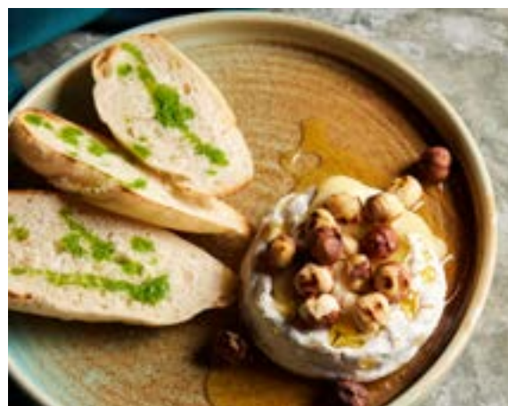
NEW ЗАПЕЧЕННЫЙ СЫР БРИ 210 г 393₽ 630₽* с фундуком, медом и хрустящим багетом