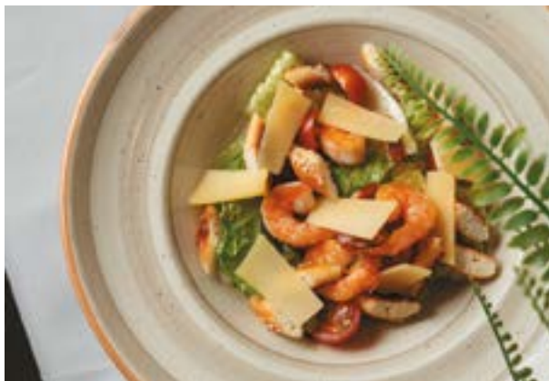
ФИРМЕННЫЙ ЦЕЗАРЬ 286₽ С КРЕВЕТКАМИ 180 г 470₽* с соусом из анчоусов

* ЦЕНА НА ВЫНОС И НА ДОСТАВКУ СЕРВИС ЕДИНОЙ ДОСТАВКИ SPARC-FOOD.COM, ТЕЛ. 235-235