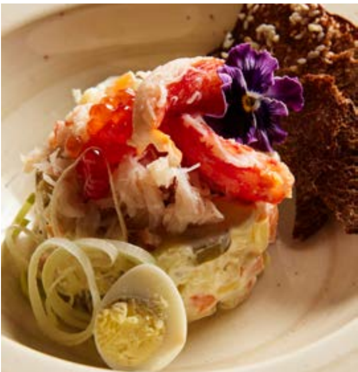
NEW ОЛИВЬЕ С МЯСОМ КРАБА 306₽ 160 г 450₽* греческим йогуртом и красной икрой