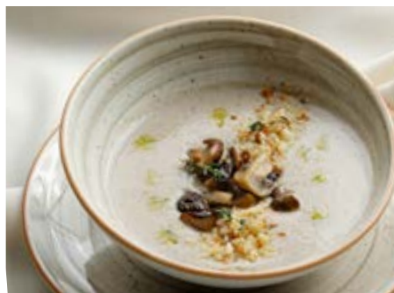
КРЕМ-СУП ИЗ ШАМПИНЬОНОВ И ШИИТАКЕ 225 г с печеньем Сбризолон и зеленым маслом