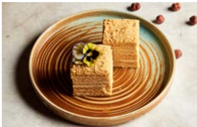
NEW ДЕСЕРТ МЕДОВЫЙ 130 г

легкие медовые коржи, прослоенные сметанным кремом