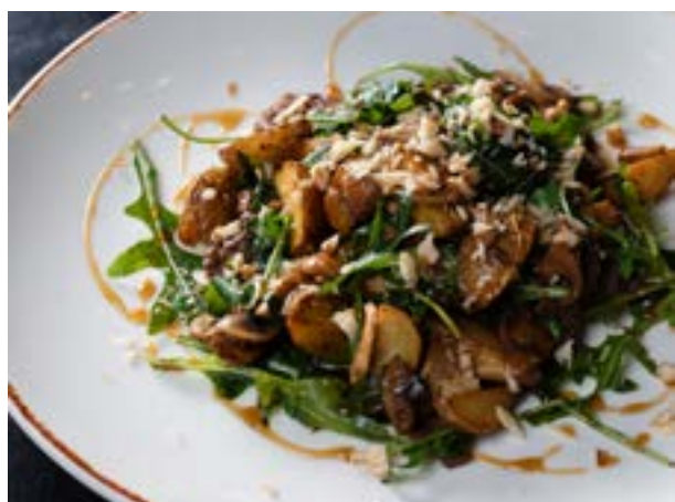
САЛАТ С ГОВЯДИНОЙ 318₽ НА ГРИЛЕ 210 г 490₽* теплым картофелем и грибами